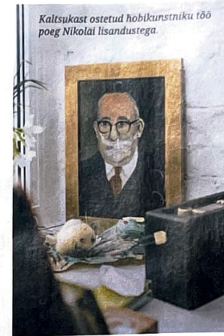
Rauli Kohtla-järve sõbra töö.

Ole tegi selle just sulle? Mis sa talle lähtekohaks andsid?